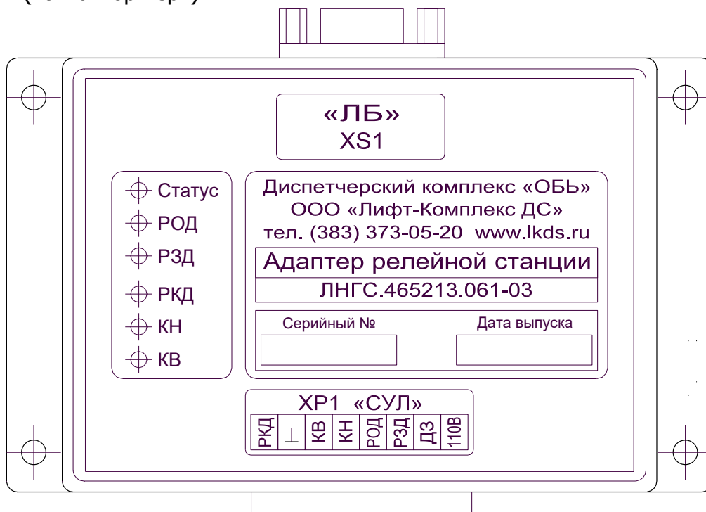
Рис. 2. Внешний вид адаптера релейной станции

1.4.3.3. На печатной плате адаптера релейной станции находятся разъемы: